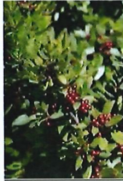
Nerprun alaterne :