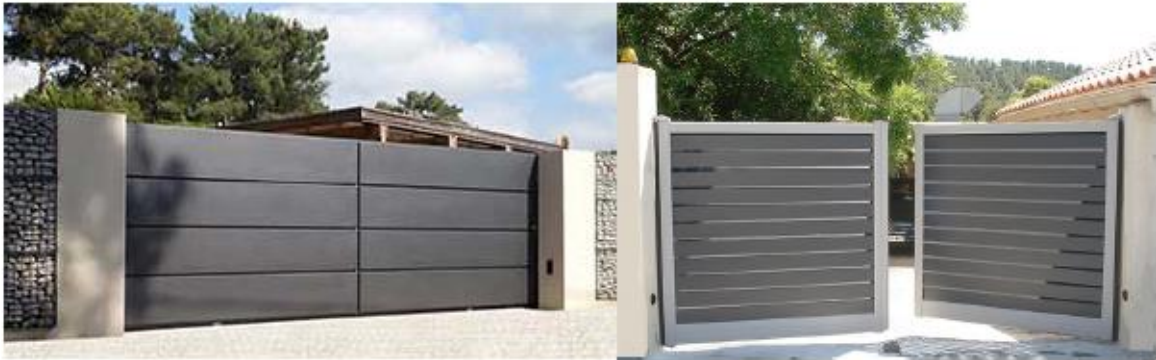
Exemple d'accès PPNC et garage - sans portail

Lorsqu'ils existent, les portails doivent rester à dessin simple - à lame horizontale - la modénature du portail doit apparaître au permis de construire.