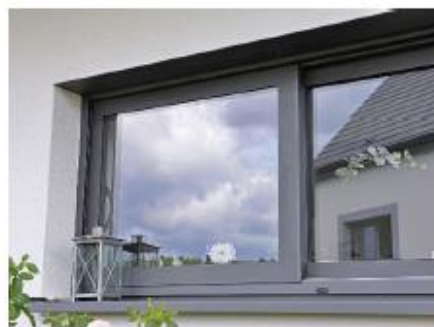
Menuiseries tons blanc et gris Vitrage complet non redécoupé par vantail