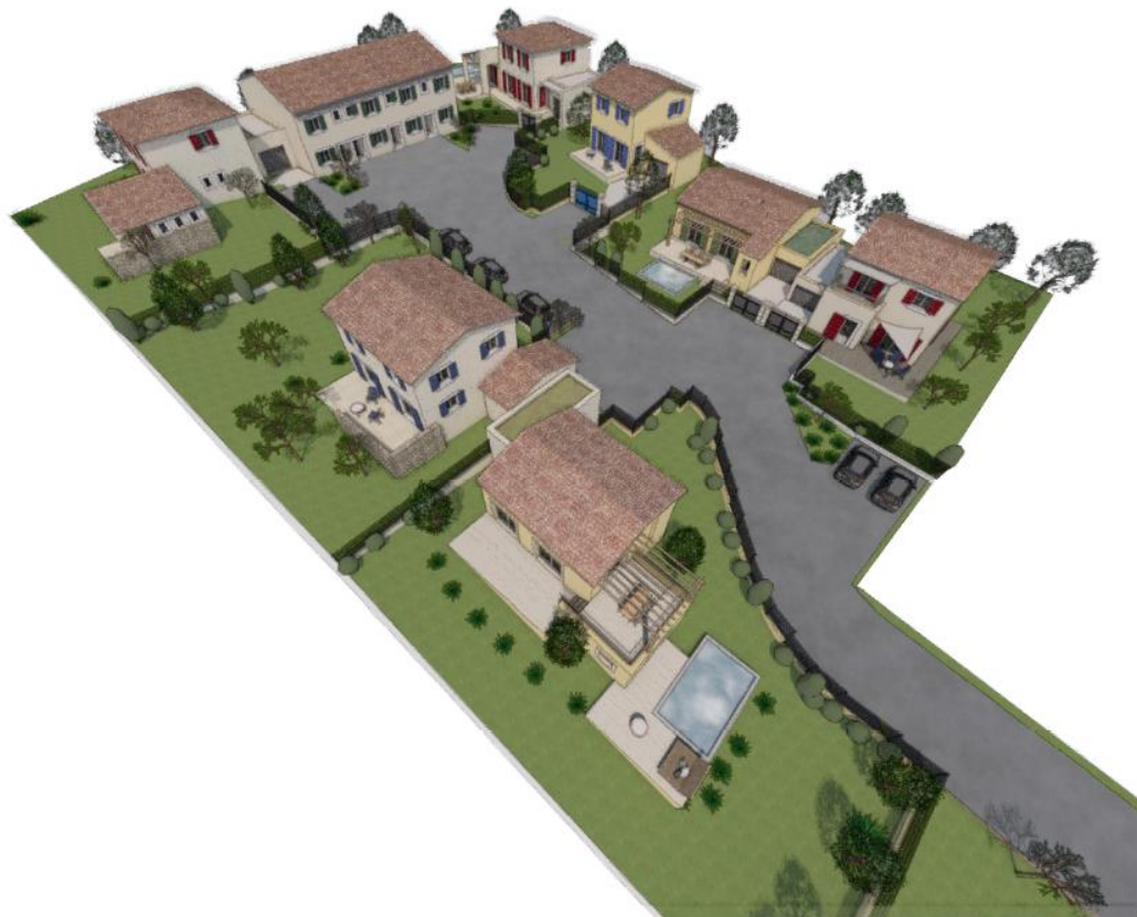
Schéma d'hypothèse d'implantation